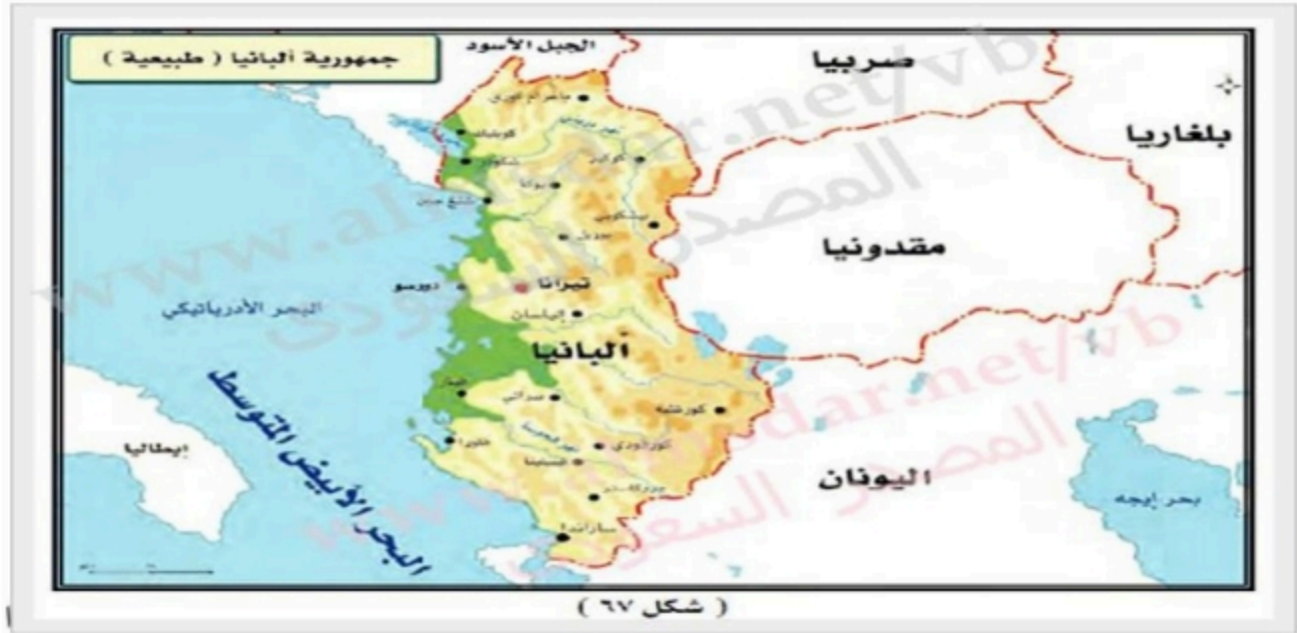
( شكل ٦٧ )

ب/ امامك خارطة لجمهورية البانيا الإسلامية تأملى الخارطة واجيبى عن التالى؟