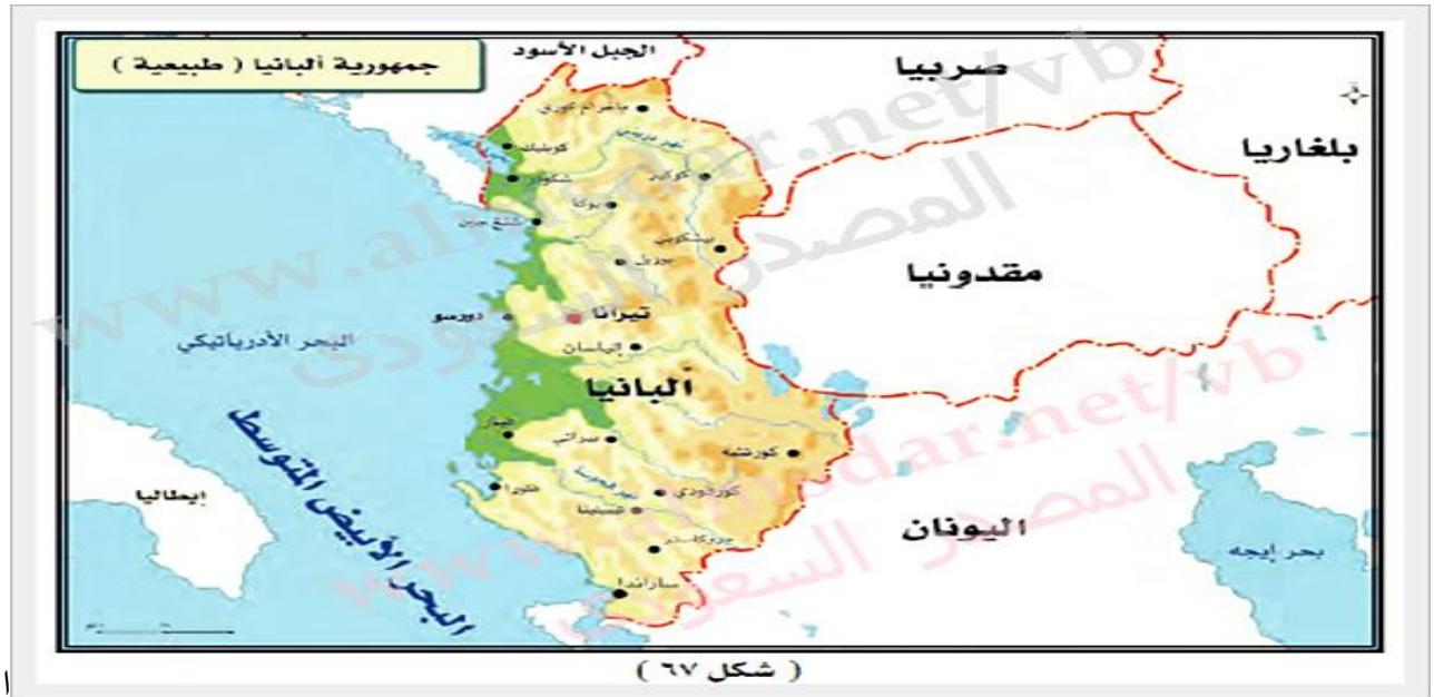
( شكل ٦٧ )

ب/امامك خارطه لجمهورية البانيا الإسلامية تأملى الخارطه واجيبى عن التالى؟